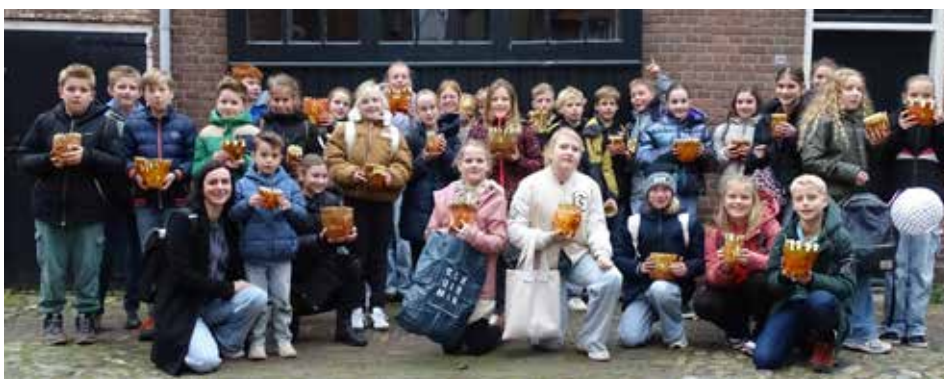
Vol trots poseren de kinderen met hun suikerbieten voor de palingrokerij aan de Rozemarijnsteeg.