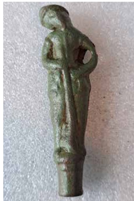
Heft van een mes uit de zestiende eeuw (voorzijde).