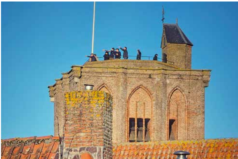
Rondleiding op de toren van de Sint-Nicolaaskerk.

Willem van Norel vertelde op vrijdagavond en op zaterdagavond tijdens vier minilezingen ijzingwekkende verhalen over barre winters. De Elburger vissers hadden hem in de loop der jaren veel verhalen verteld over hun avonturen op het ijs tijdens het vissen op spiering. Een van de strengste winters was die van 1929, toen de Zuiderzee dertien weken dichtgevroren was. Willem vertelde zijn verhalen aan de hand vijftien Elfstedentocht winters. De winterverhalen werden ondersteund met prachtige beelden.