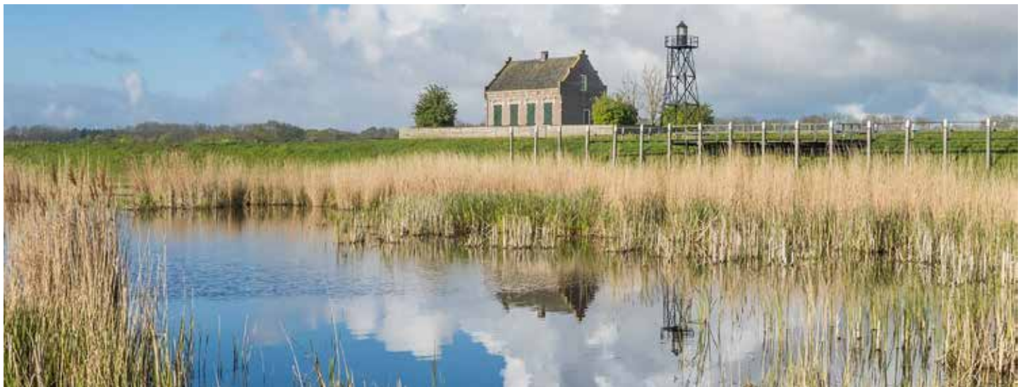
De lichtwachterswoning van Emmeloord op de noordpunt van Schokland.