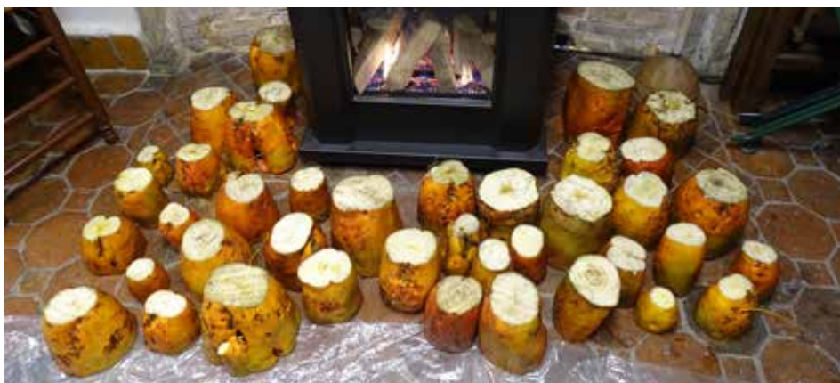
De uitgeholde en voorbereikte bieten staan gereed om versierd te worden door de kinderen.

Sonde sonde Marten De koonen dragen starten De kalvers dragen hoorens Rieke rieke torens Hier woont zo'n rieke man Die zoveule geven kan Veule kan e geven Zalig zal e leven Stook vuur, stook vuur Sonde Marten is zo duur