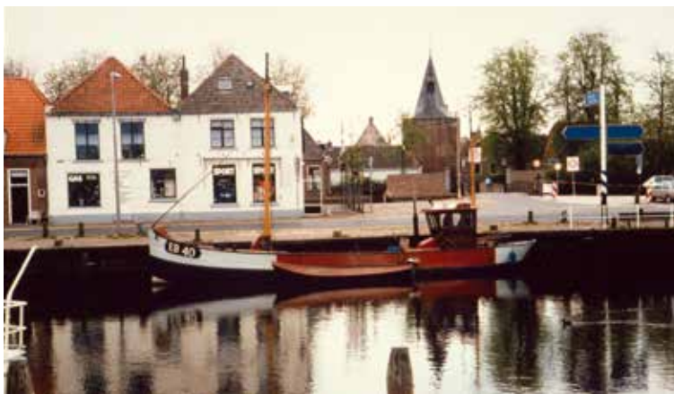
De kotter EB 40 in de Elburger haven.

filmbeelden over kotters vertoonde. Het werd een sfeervolle en gezellige avond, waar (bijna) uitsluitend in het Elburger dialect werd gesproken. Veel mensen hebben tussen kerst en nieuwjaar de prachtige kotters in de Elburger haven bewonderd.