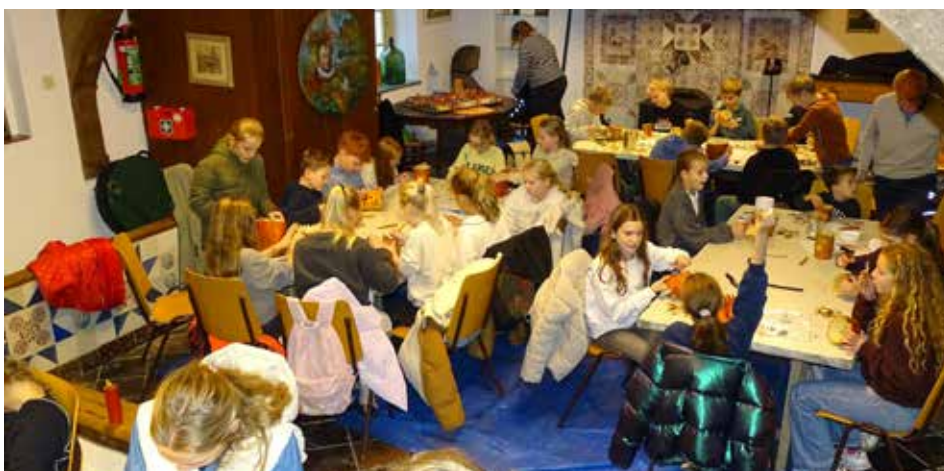
De kinderen deden hun uiterste best om de bieten mooi te versieren.