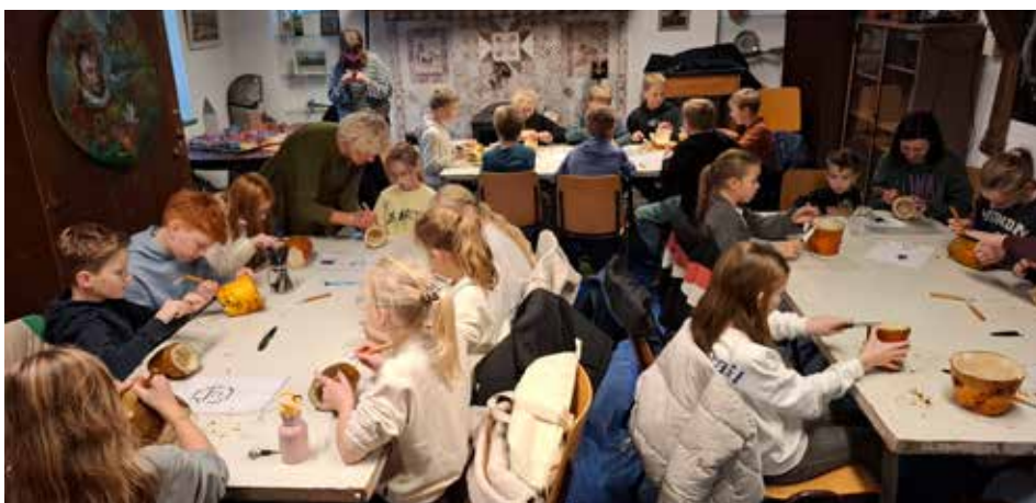
De kinderen met de begeleiders tijdens het versieren van de suikerbieten.