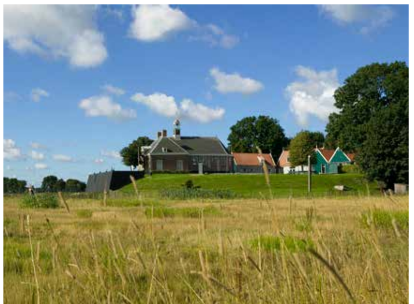
De Middelbuurt met het karakteristieke kerkje op Schokland.