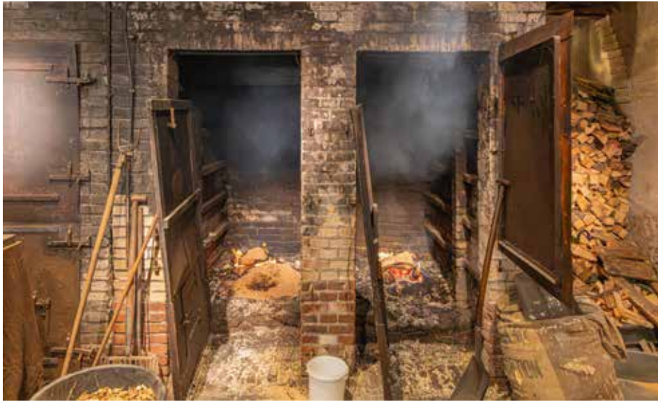
Beeld van de rookkasten in de palingrokerij.