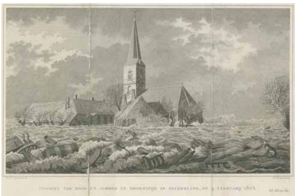
De Sint-Ludgeruskerk raakte tijdens de verwoestende golven van de watersnoodramp in 1825 zwaar beschadigd [Noord-Veluws Archief].