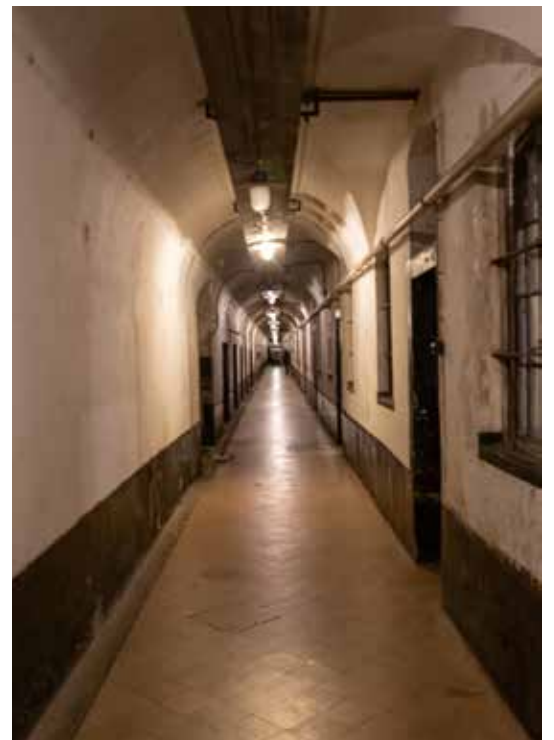
Het gangenstelsel in de bunkers van Fort Breendonk.