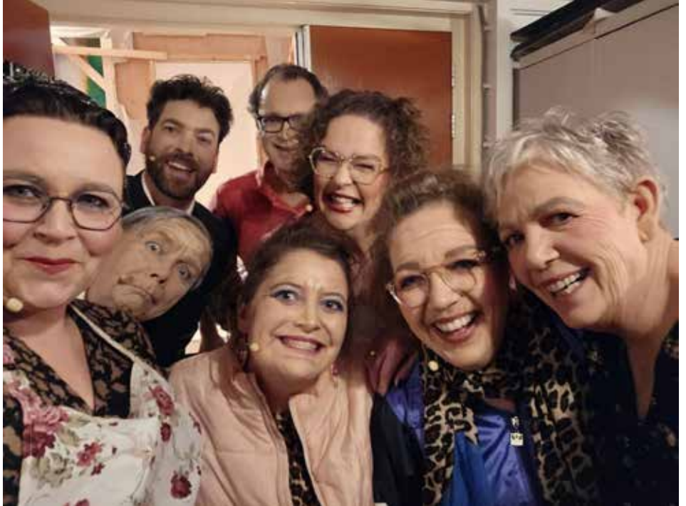
Leden van de Toneelgroep Zalk verzorgen op 21 maart twee optredens in het Buurtgebouw in Oostendorp.

Vermeld in de mail het gewenste aantal kaarten en of u 's middags of 's avonds de voorstelling wilt bezoeken. Kaarten kunnen in de voorverkoop ook gekocht worden bij Gerrit Westerink, Clakenweg 67 en Eibert Elbertsen, Kreengoedweg 7 in Oostendorp.