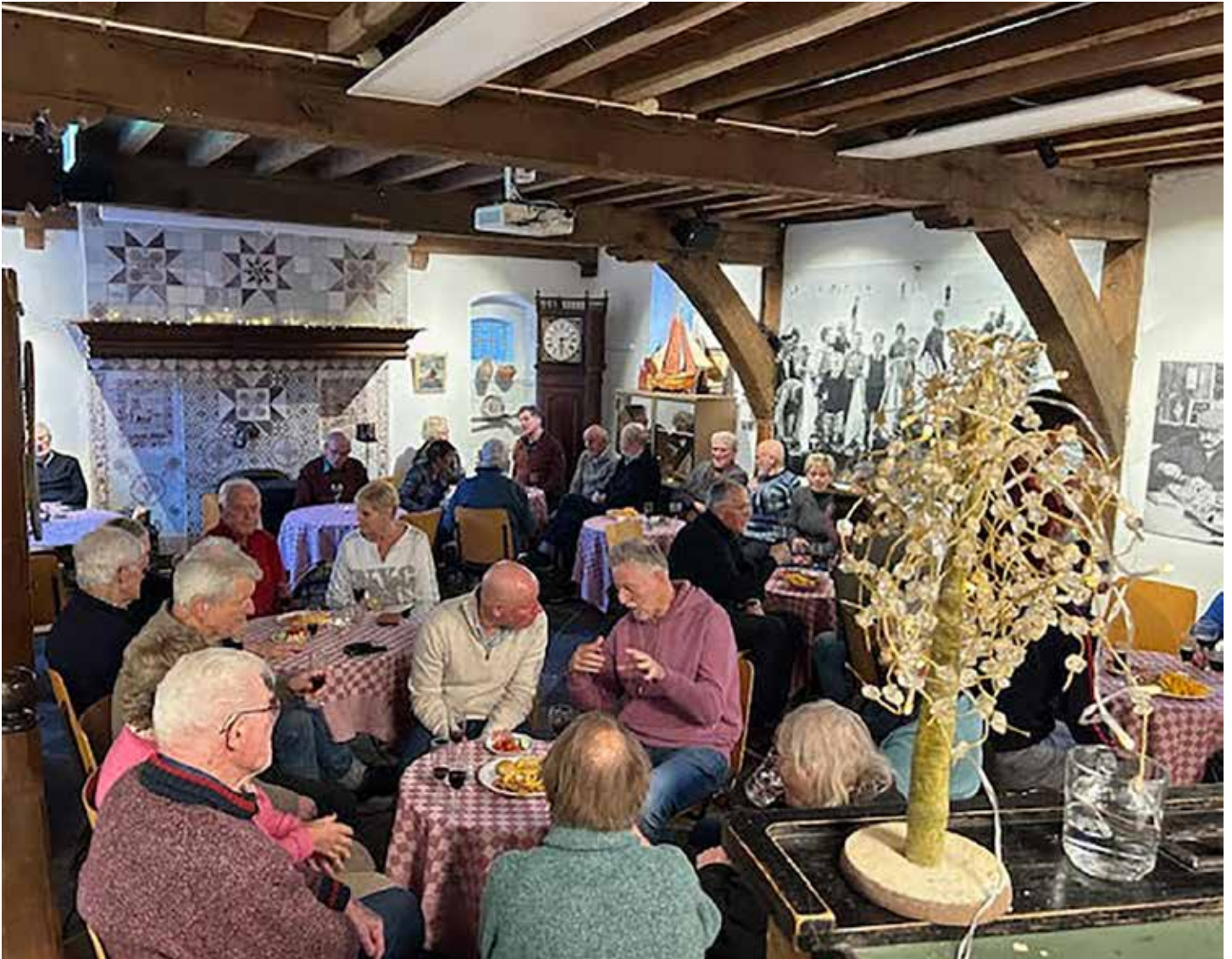
Er werden gezellige gesprekken gevoerd tijdens de Nieuwjaarsreceptie.