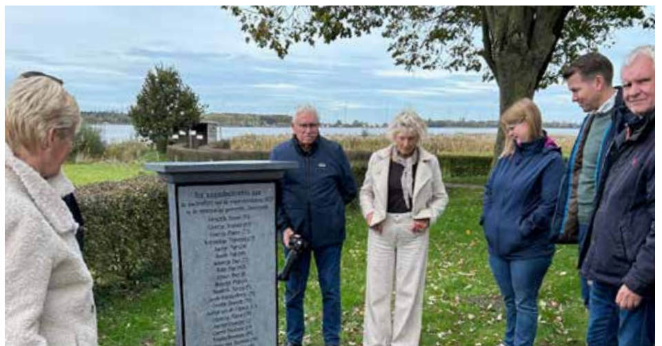
Onthulling van het namenmonument bij de Ludgeruskerk ter nagedachtenis aan de slachtoffers van de watersnoodramp van 1825.

van de Commissie Zeevloed is een blijvend resultaat van het afgelopen jaar. Dankzij dit project kan iedereen nu vanuit huis grasduinen in een schat aan documenten over de stormvloed van 1825.