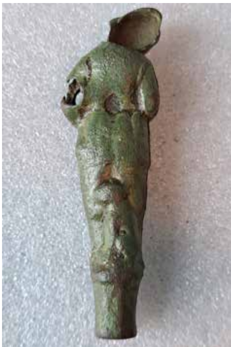
Heft van een mes uit de zestiende eeuw (achterzijde).

Ook is er bij Elburg een muntstuk van 5 cent uit 1940 gevonden, uitgegeven onder koningin Wilhelmina, voor gebruik op Curaçao. Deze munt werd ook gebruikt als 'oorlogsgeld' tijdens de jaren 1940-1945. De voorzijde beeldt een vruchtdragende oranjetak uit. Op de achterzijde wordt een parelrand met schelpen uitgebeeld.