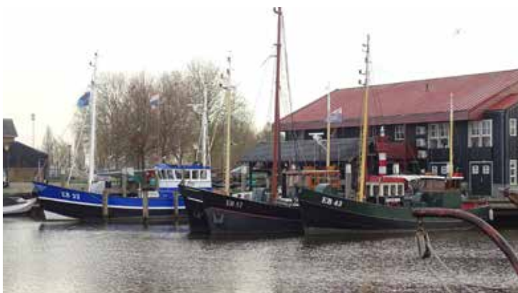
Drie Elburger kotters afgemeerd bij de Botterwerf (december 2025).