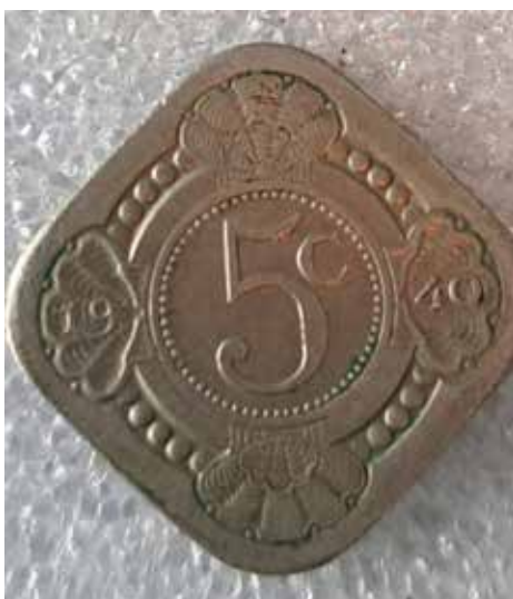
Muntstuk van 5 cent uit 1940 (voorzijde).