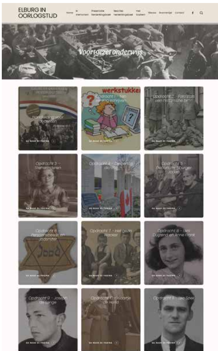
Printscreen van een deel van de website.