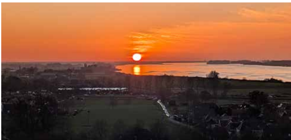
Zicht vanaf de toren van de kerk op zaterdagmiddag 13 december 2025 om 16.00 uur.