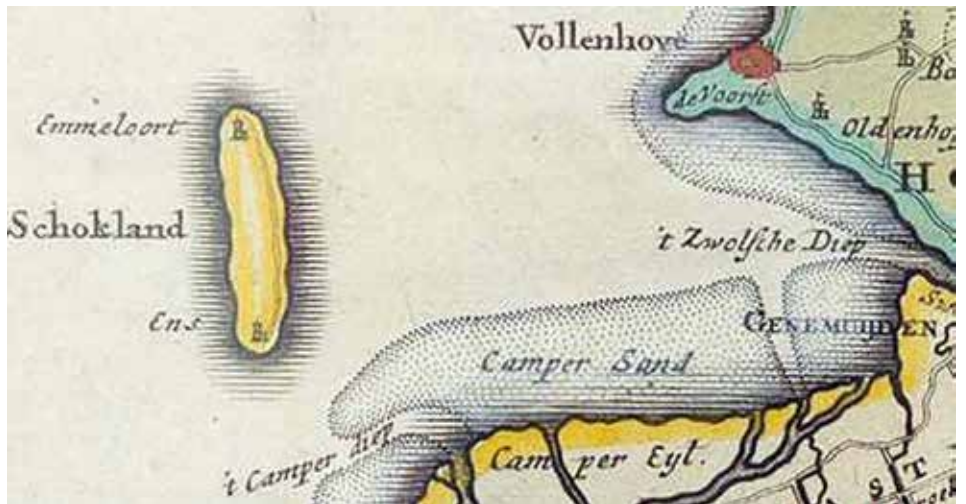
Detailtekening van het voormalige eiland Schokland voor de kustlijn van Overijssel.