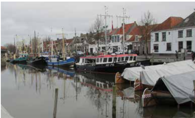
De kottervloot tijdens de Kerstdagen van 2025 in de Elburger binnenhaven.