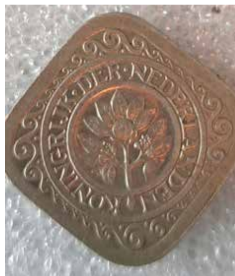
Muntstuk van 5 cent uit 1940 (achterzijde).