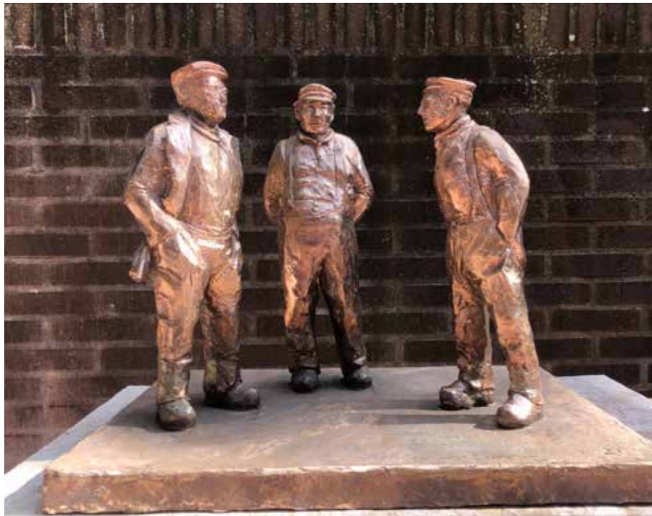
Bronzen beeld van drie Elburger vissers, gemaakt door Francien de Jonge.

Op een aantal terreinen werken Arent thoe Boecop en de Elburger Botterstichting samen. Het visserijverleden van Elburg in brede zin des woords raakt de beide organisaties volop. Arent thoe Boecop geeft boeken over de visserijgeschiedenis uit, organiseert Visserijavonden met prachtige filmbeelden, houdt de