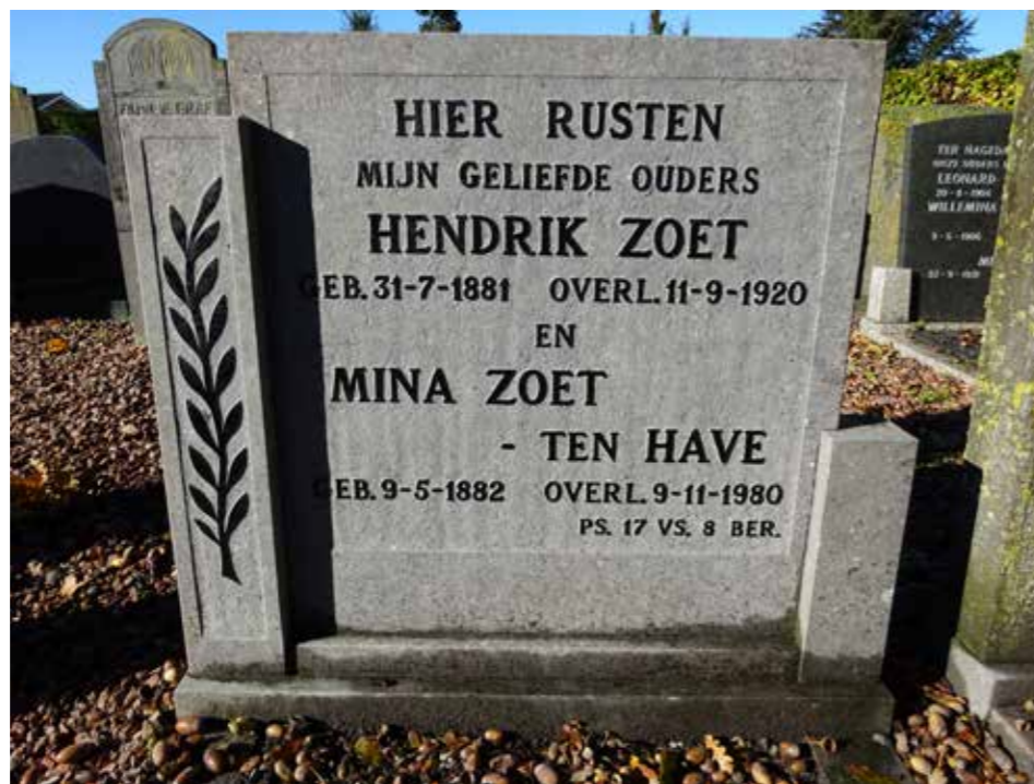
Het gerestaureerde graf van de familie Zoet-ten Have.

De begraafplaats aan de Nunspeterweg raakte omstreeks 1980 vol. Steeds vaker werden Elburger burgers begraven op de begraafplaats aan de Bovenweg op 't Harde. Vanaf die tijd trad heel geleidelijk het verval van de begraafplaats in. De grafstenen werden nauwelijks onderhouden of zakten weg. De teksten werden steeds minder leesbaar en het onkruid kreeg steeds meer de overhand. Tegelijkertijd maakte de publicatie duidelijk dat op de begraafplaats diverse unieke grafmonumenten staan. Vaak