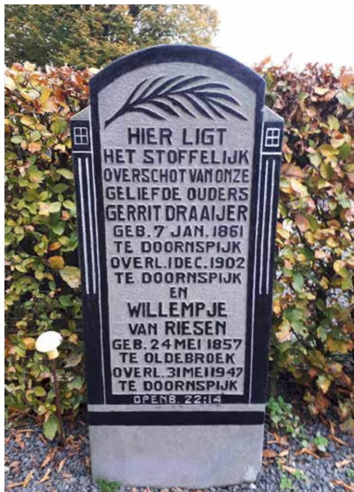
Graf van de familie Draaijer-van Riessen.

Verder kwam er vanuit de werkgroep het idee om een bijzondere wegbewijzingspaal bij de ingang van