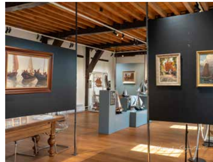
Beeld van de sfeervol ingerichte expositieruimte in Museum Elburg.