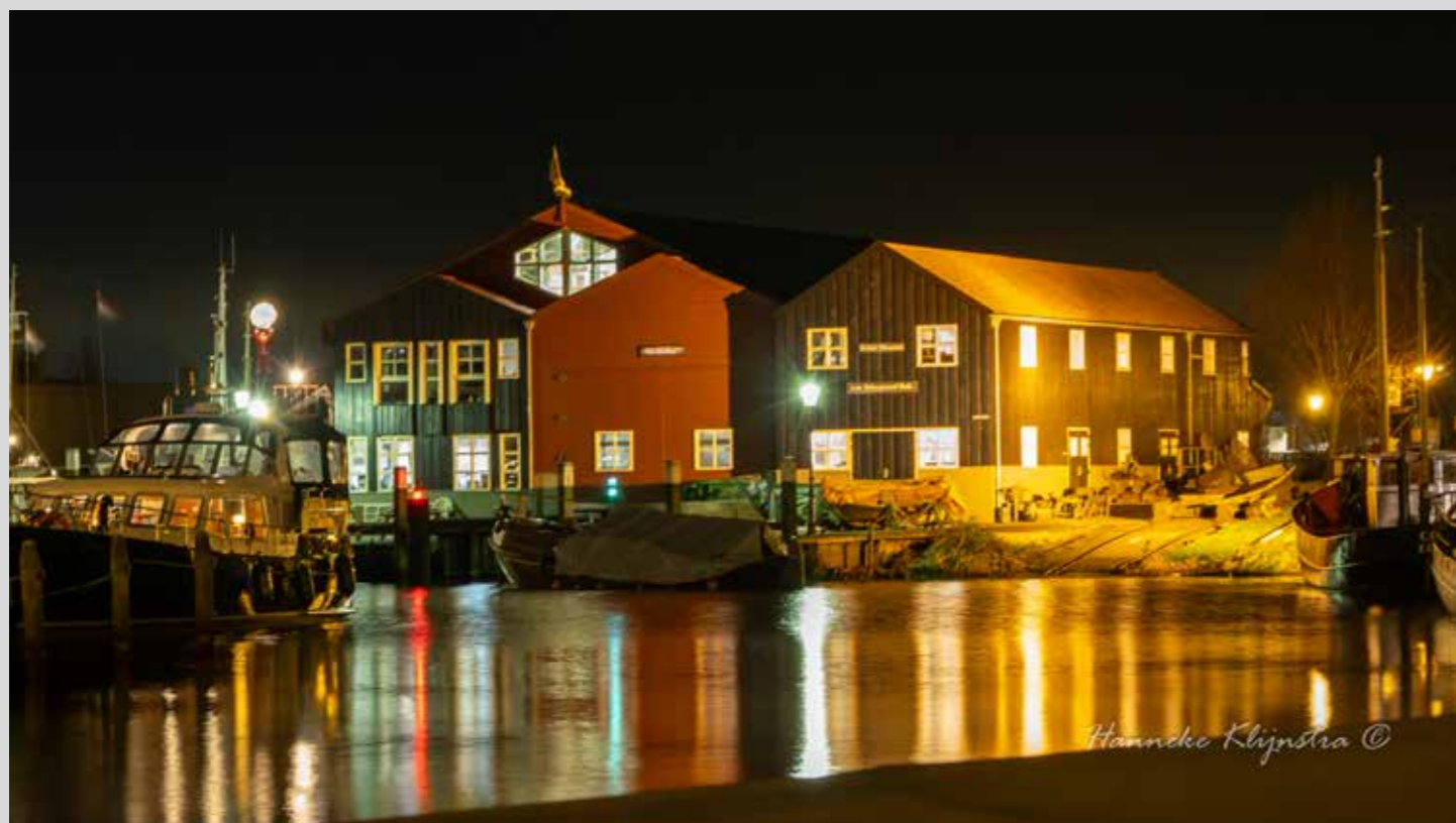
De Botterwerf bij avondlicht (17 december 2024).