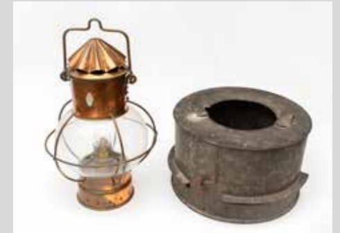
Kap die de visseers moesten gebruiken om het licht van de lampen af te schermen.