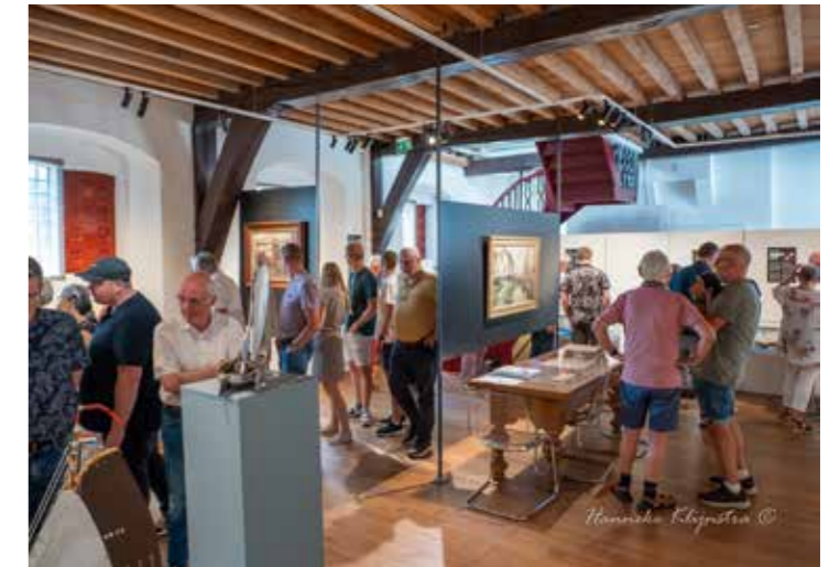
De tentoonstelling heeft veel bezoekers getrokken.