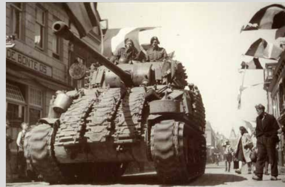
Op 19 april 1945 kwamen de geallieerden Elburg bevrijden.

Zeer waarschijnlijk zullen we later in het jaar een excursie per bus organiseren waarbij Ad van Liempt ons ter plekke zal rondleiden op de bijzondere plekken in Nederland waar tijdens de oorlog (heftige) gebeurtenissen hebben plaatsgevonden.