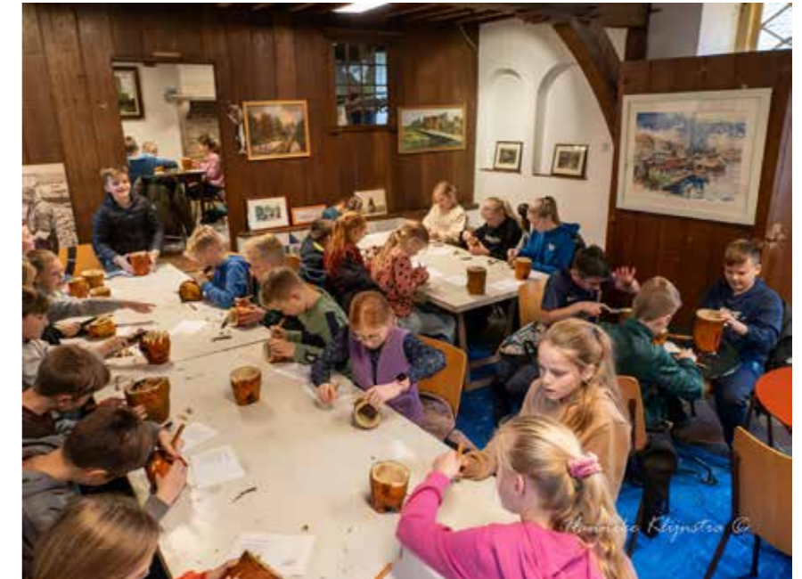
Een grote groep kinderen van de PWA school waren op 11 november in het Gruithuis aan het werk.

De bijeenkomst werd begonnen met het uit volle borst oefenen van het traditionele Sonde Martenlied. Veel kinderen bleken dit liedje al te kennen. Vervolgens gingen de schoolkinderen met grote ijver aan de slag met het insnijden van de suikerbieten. De kinderen werden daarbij begeleid door vrijwilligers van Arent thoe Boecop. Nadat alle kinderen hun werk klaar hadden, kwam het spannende moment om de kaarsjes aan te steken. Daarna werd op de hoek van de Krommesteeg en de Rozemarijnsteeg een groepsfoto gemaakt, waarna de kinderen zich met verlichte bieten in de donkere palingrokerij begaven. Een mooi, maar vooral ook spannend moment.