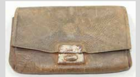
Portemonnee van Eibert Spaan, teruggegeven in 2010. Spaan stierf kort na zijn vrijlating aan algehele verzwakking.