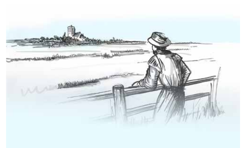
De vernieuwde website van Arent thoe Boecop zal voortaan herkenbaar zijn aan dit beeld.