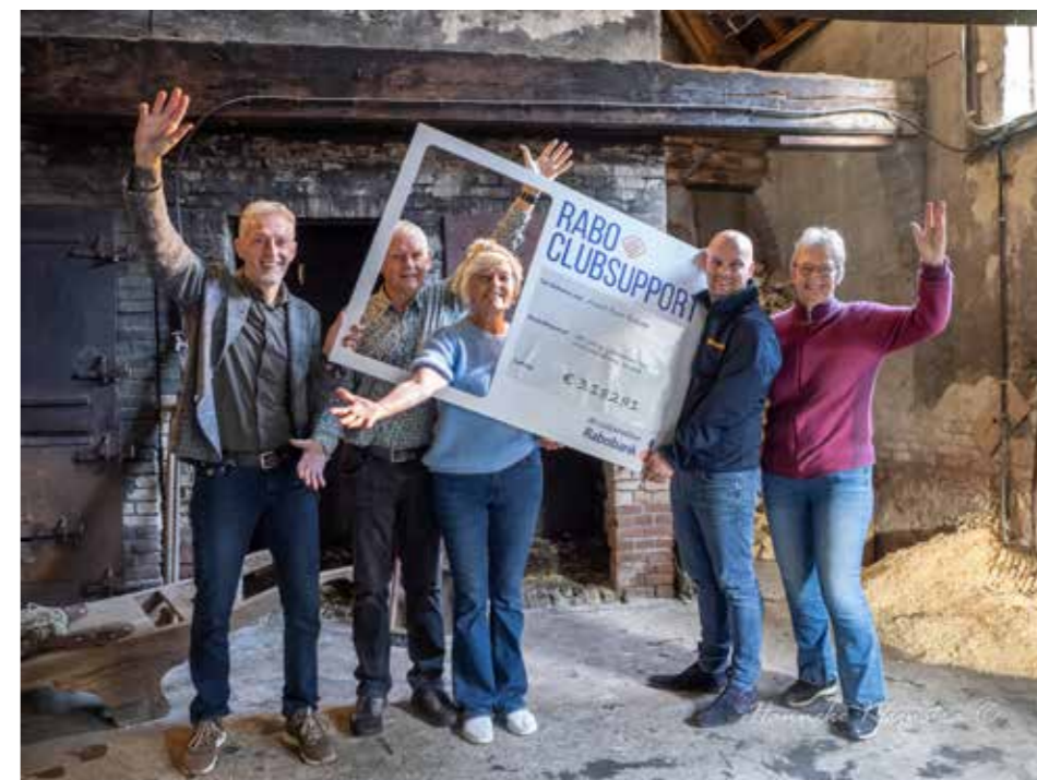
Het bestuur van Arent thoe Boecop ontvangt vol trots de cheque van de RABO-bank.