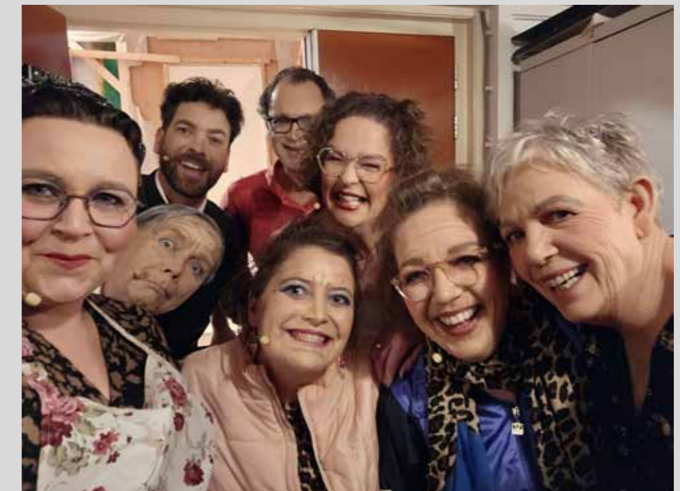
De toneelvereniging uit Zalk verzorgt op 29 maart twee voorstellingen in het Buurtgebouw in Oostendorp.

In Dierentuin ZooZalk wordt een nieuw apenverblijf gebouwd. De opening van dit verblijf moet een enorm feest worden en daarom heeft de directrice van de dierentuin, de Koning uitgenodigd om de openingshandeling te verrichten. Maar voordat het zover is, zal er eerst een inspectie uitgevoerd moeten worden door de Rijksvoorzichtingsdienst. Helaas mankeert er nogal wat aan het reilen en zeilen van de dierentuin.