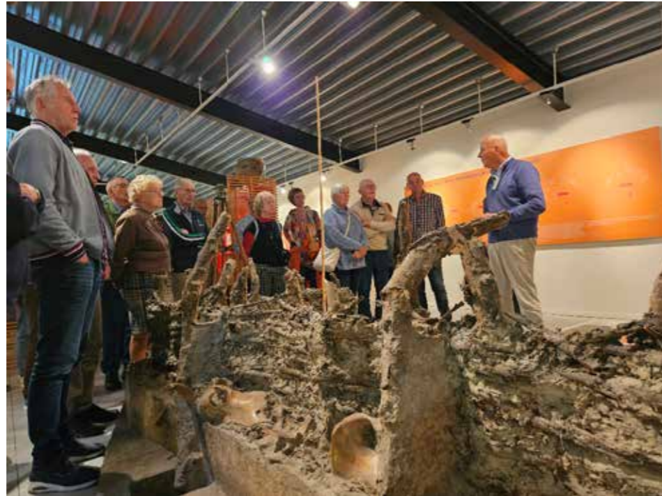
Een gids geeft onze leden uitleg in Museum Wierdenland in Ezinge.

De derde aanlegplek was Ezinge. Naast een bezoek aan het fraaie museum, leidden twee gidsen de groepen naar de op de hoge terp gelegen kerk aan de rand van het dorp. Daar werd het verhaal verteld over de afgravingen van de terp en de daarbij gedane unieke vondsten in de vorige eeuw onder leiding van professor Van Giffen.