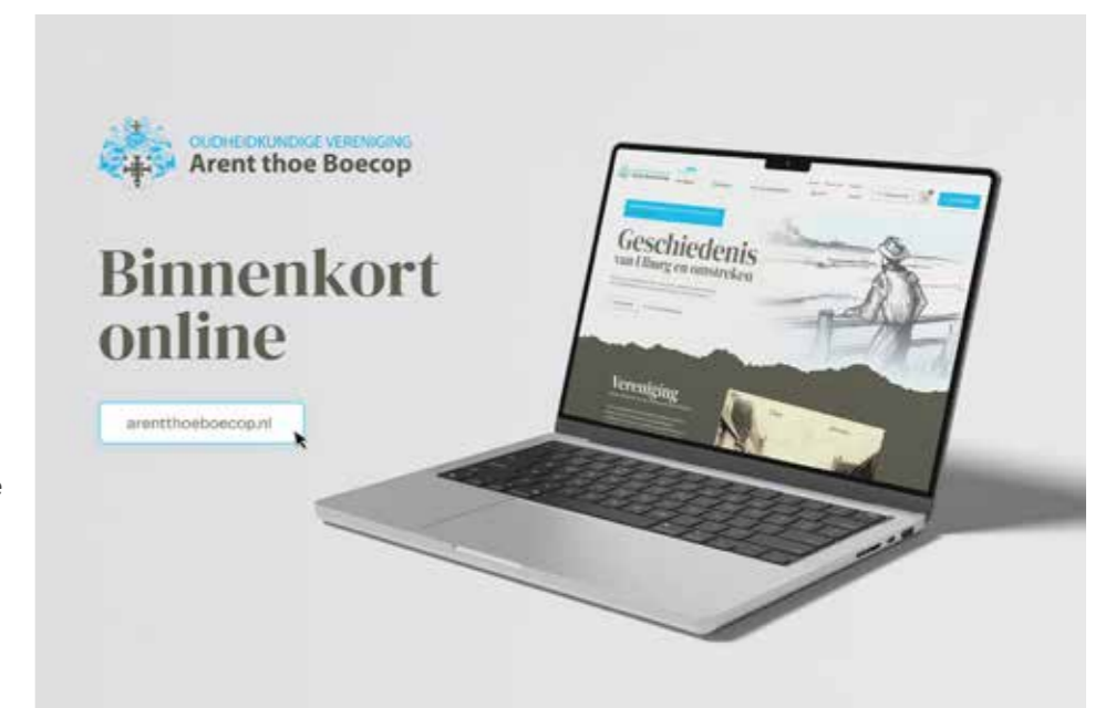
Voorbeeldweergave van de nieuwe website.