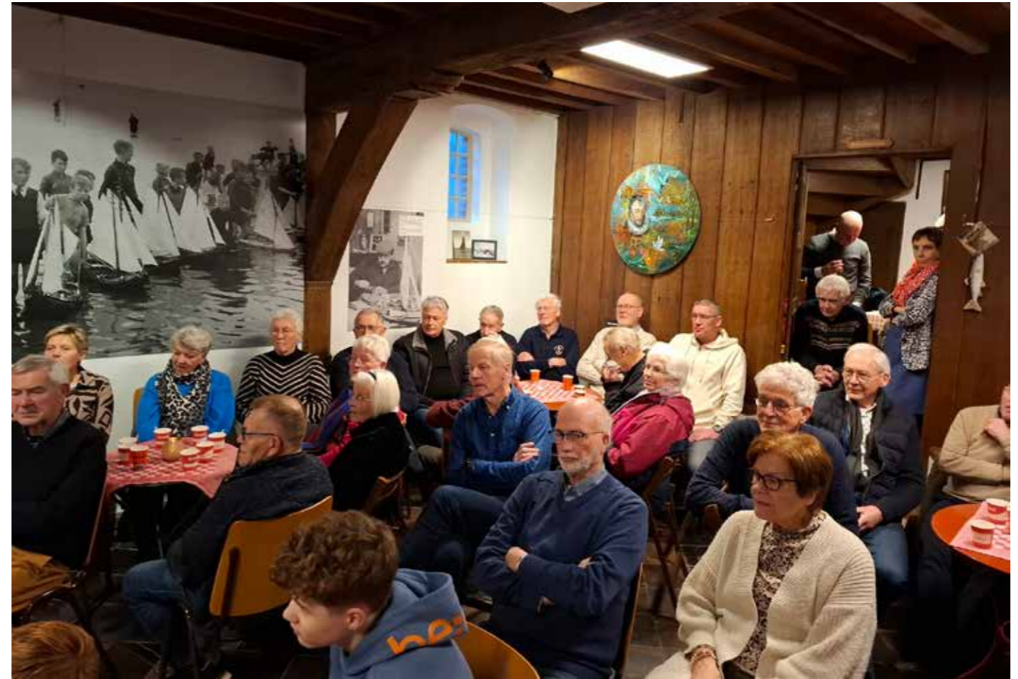
Er was ook deze keer weer een grote opkomst bij de nieuwjaarsreceptie.

Geschiedenis zal altijd belangrijk zijn voor de mens: een cliché, maar onze toekomst heeft altijd haar wortels in het verleden. Een kwestie van oorzaak en gevolg. Voor ons als Arent thoe