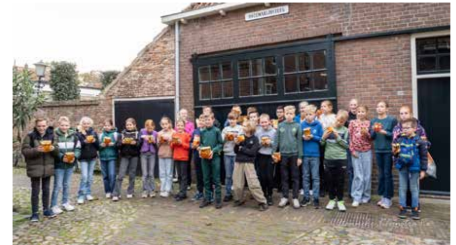
De kinderen tonen in de Rozemarijnsteeg vol trots hun bewerkte suikerbieten.

Sonde sonde Marten De koonen dragen starten De kalvers dragen hoorens Rieke rieke torens Hier woont zo'n rieke man Die zoveule geven kan Veule kan e geven Zalig zal e leven Stook vuur, stook vuur Sonde Marten is zo duur.