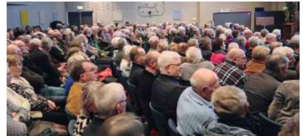
De Visserijavonden trokken opnieuw twee stampvolle zalen in Het Huiken.