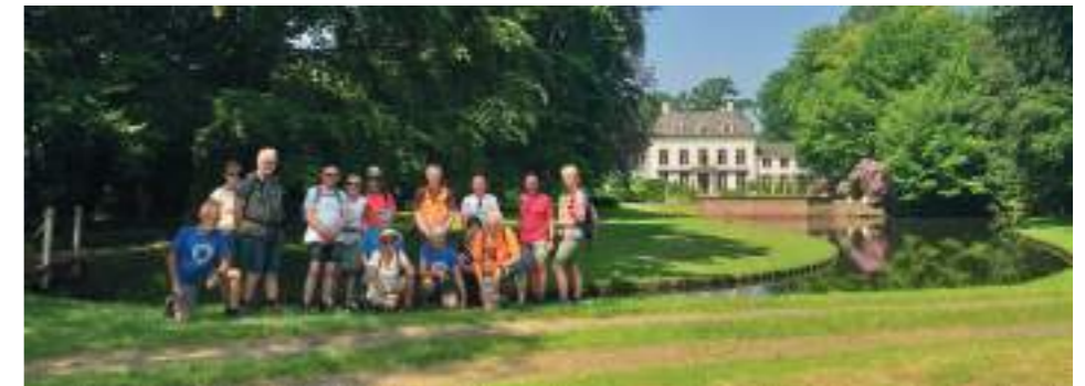
De wandellaars poseren op 18 mei op het Landgoed Klarenbeek in Doornspijk.