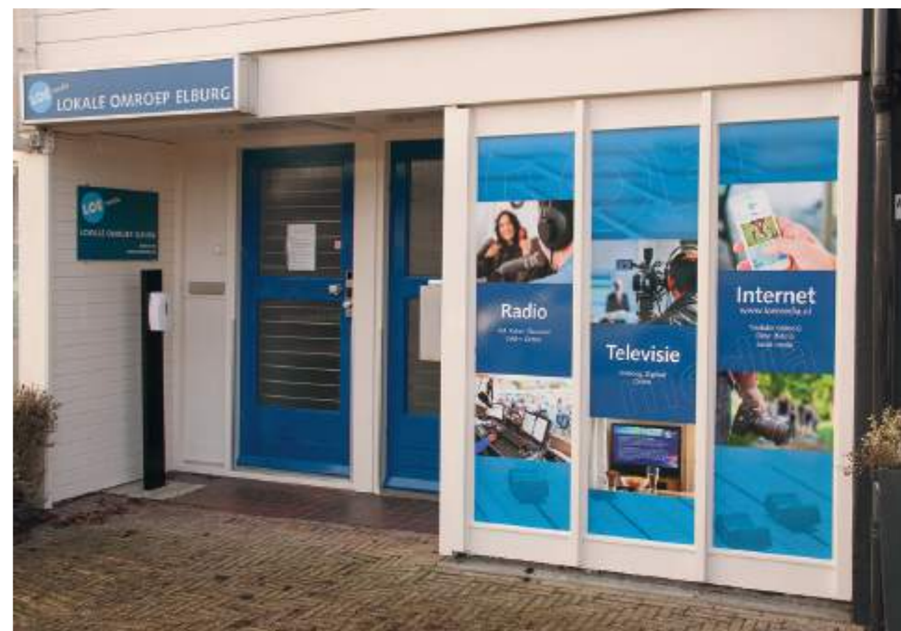
De voorpui van de studio van de LOE aan de Vrijheidsstraat.