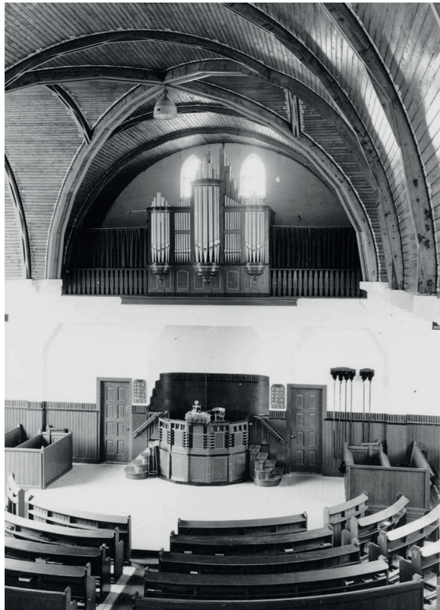
Het oude kerkgebouw en (op de achtergrond) de nieuwe Gereformeerde kerk van Doornspijk in 1924