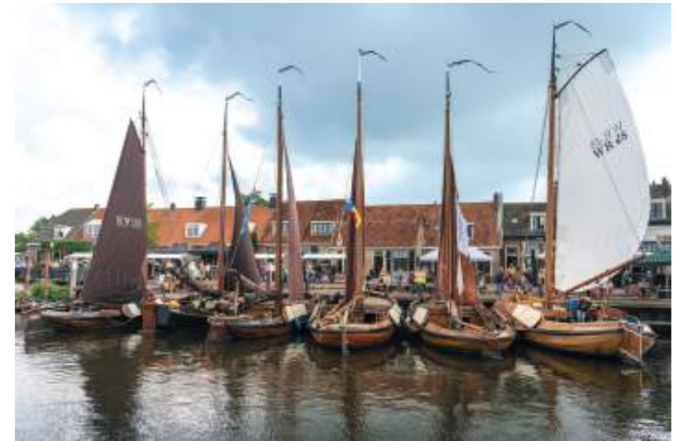
De haven van Elburg tijdens de Open monumentendag en Botterdagen 2022.