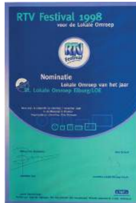
De nominatie in 1998 voor het RTV festival.

elk geval niet genoeg om de technische apparatuur te kopen die nodig is voor een radiogeluid zonder ruis en voor goede tv-presentaties. Ook de reclame op de radio en de kabelkrant levert te weinig op voor extra investeringen in techniek. In november 1996 en juni 1997 ontvangen de inwoners en de ondernemers in de gemeente Elburg een brandbrief met de vraag: 'Moet de LOE blijven? Met tegelijk het antwoord: 'Ja, de LOE moet blijven.' Daarop volgt een verzoek: "Draagt u