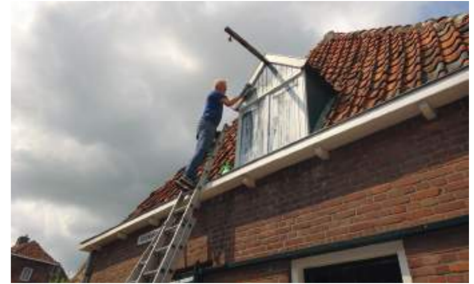
Willem van Norel schildert het dakkapelletje.

Tijdens de Botterdagen, op zaterdag 14 september, kan het publiek tijdens een open dag de oude palingrokerij voor het eerst bewonderen. Voor eventuele nadere inlichting kunt u contact opnemen met Willem van Norel (willemvannorel56@gmail.com tel. 0525-684595).