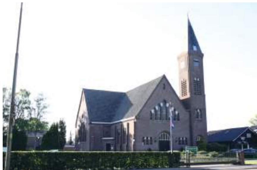
Het oude kerkgebouw en (op de achtergrond) de nieuwe Gereformeerde kerk van Doornspijk in 1924