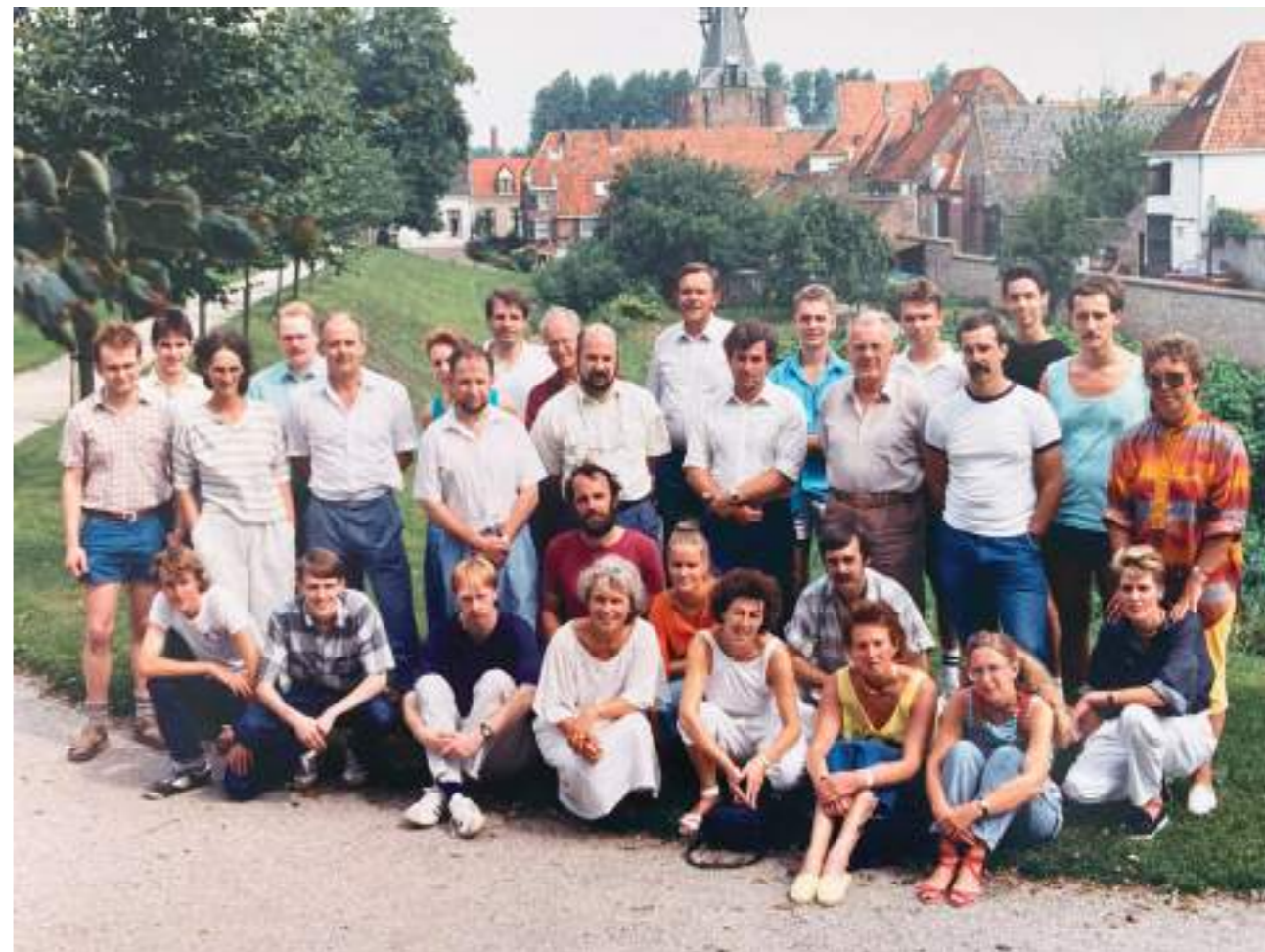
Medewerkers LOE (jaar?)

het cijfer 8. Er zijn echter ook kritiekpunten die de LOE zich ter harte moet nemen.