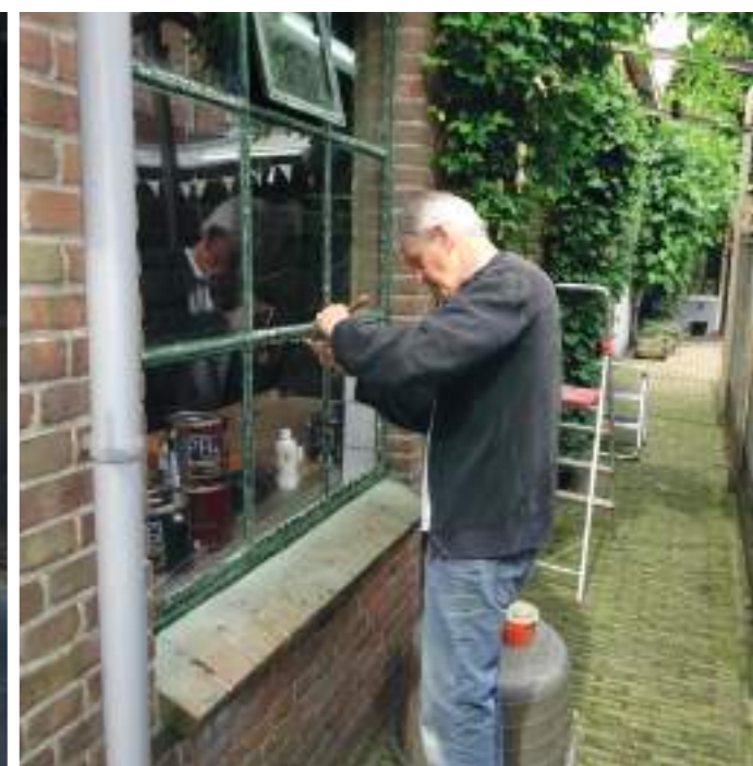
Werkzaamheden in de rokerij.