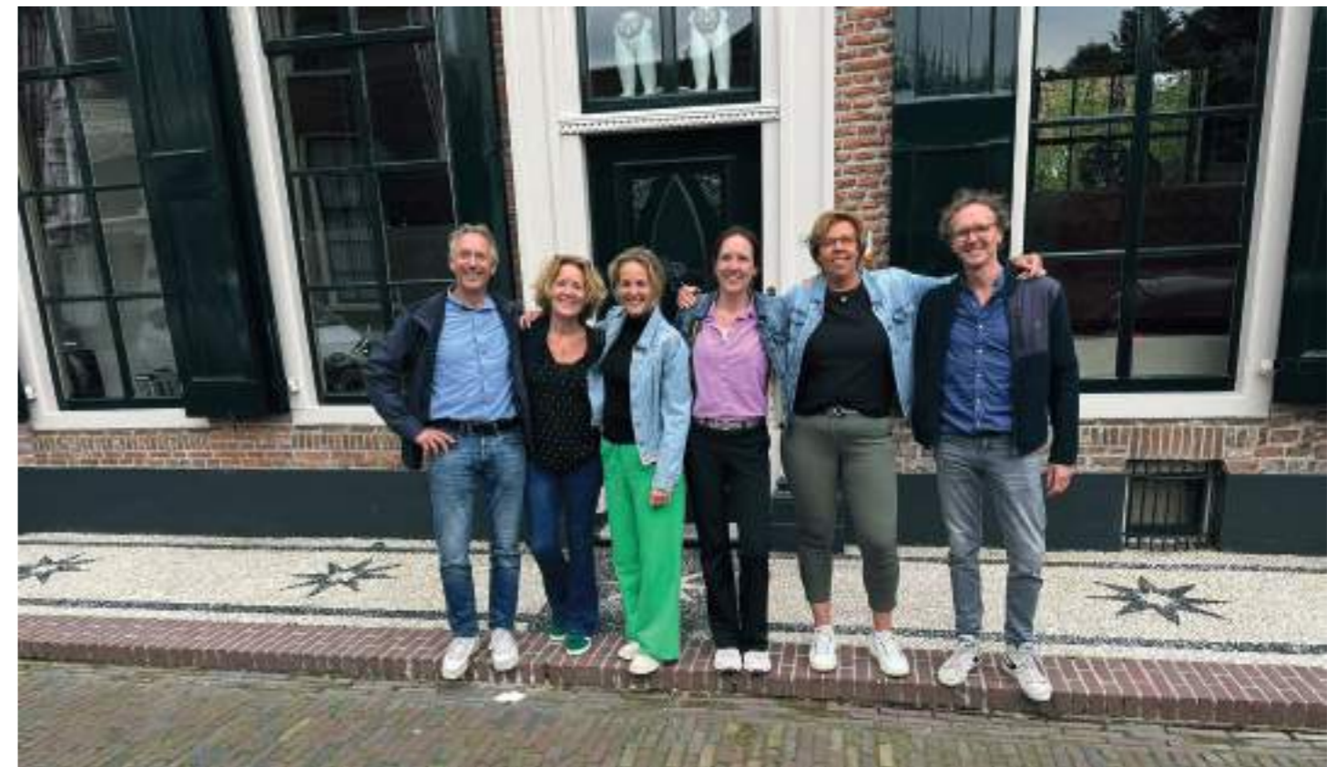
De kleinkinderen van de familie Slebos op de stoep van het pand Van Kinsbergenstraat 3.