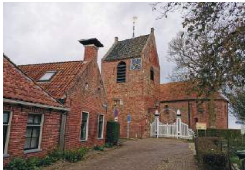
De kerk van Ezinge.