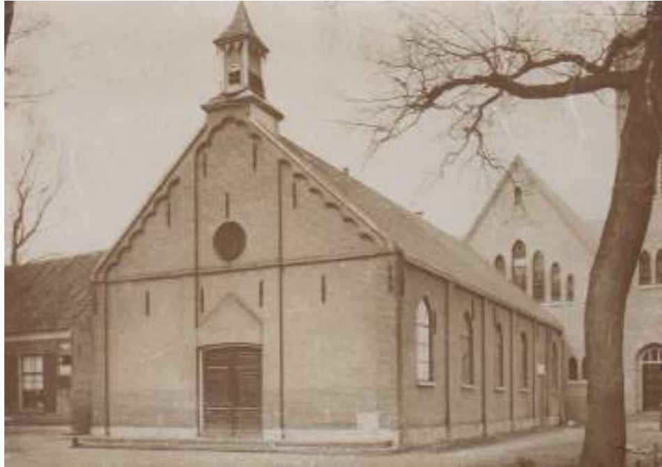
Het oude kerkgebouw en (op de achtergrond) de nieuwe Gereformeerde kerk van Doornspijk in 1924

De kerkenraad neemt uiteindelijk eind mei 1923 een definitief besluit over de bouw. Het Overveluwsch Weekblad en het Nieuws- en Advertentieblad voor Elburg en omstreken vermelden in hun