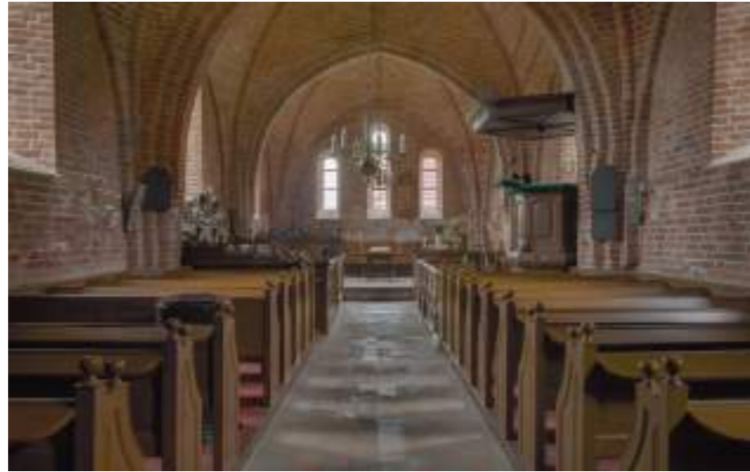
Het interieur van de kerk van Ulrum waar in 1834 de Afscheiding begon.

De inschrijving start op vrijdag 4 oktober. Er kunnen maximaal 50 leden mee. Voor eventuele inlichtingen kunt u contact opnemen met Willem van Norel ( willemvannorel56@gmail.com of 0525-684595).