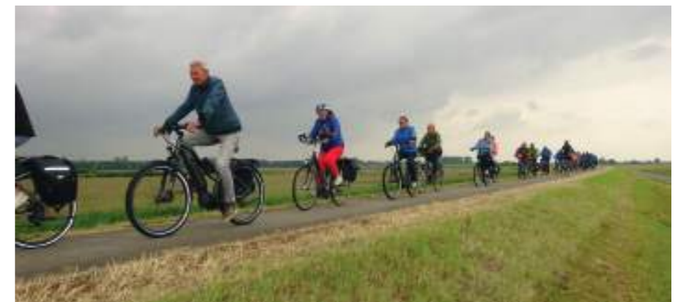
Een lang lint van fietsers op de Zomerdijk tussen Kampen en Elburg op 8 juni.