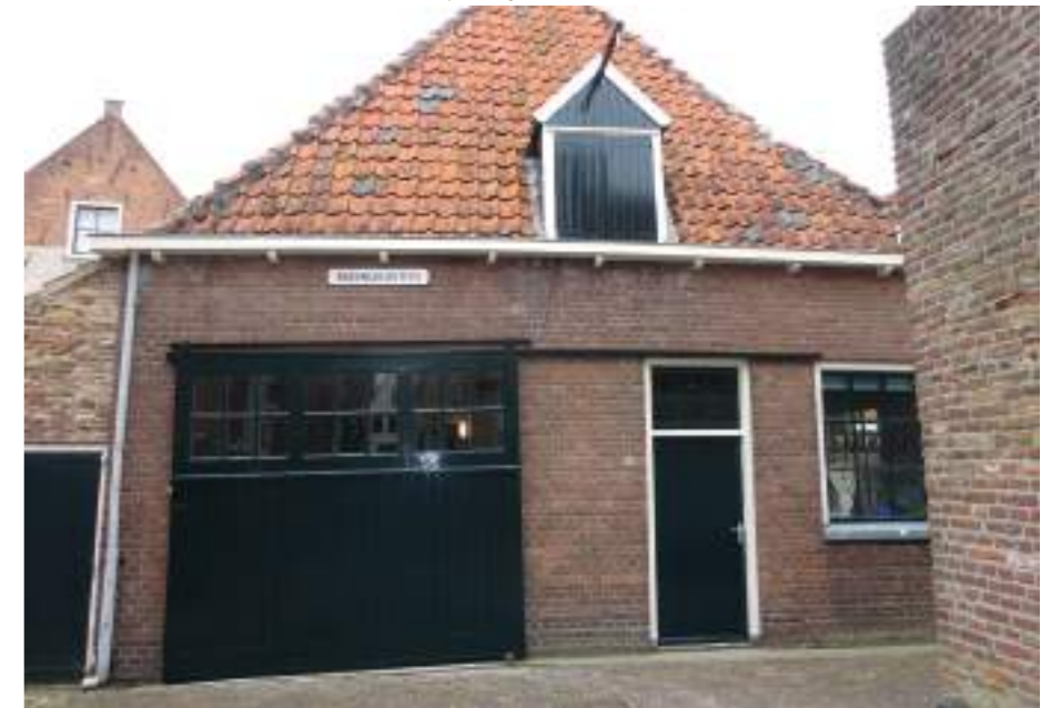
De rokerij na de schilderwerkzaamheden.