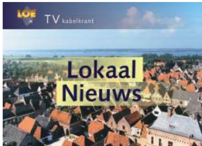
LOE achtergrondbeeld van het Lokaal Nieuws.