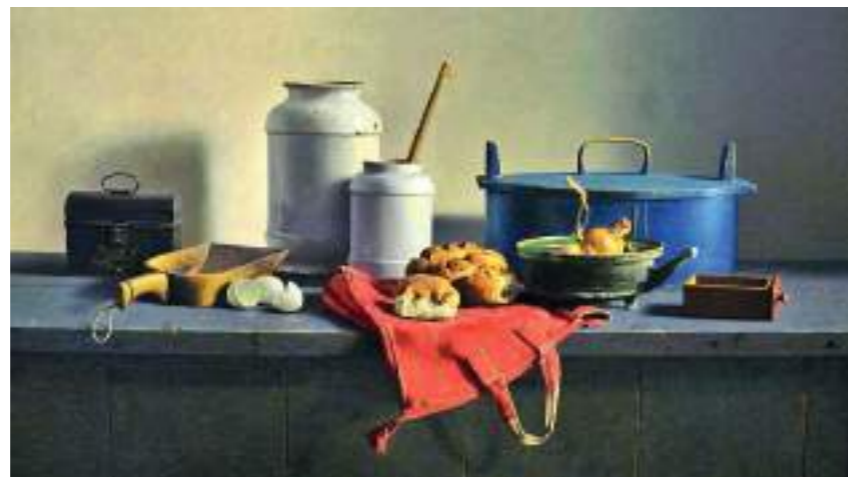
Een prachtig stilleven geschilderd door Henk Helmantel.