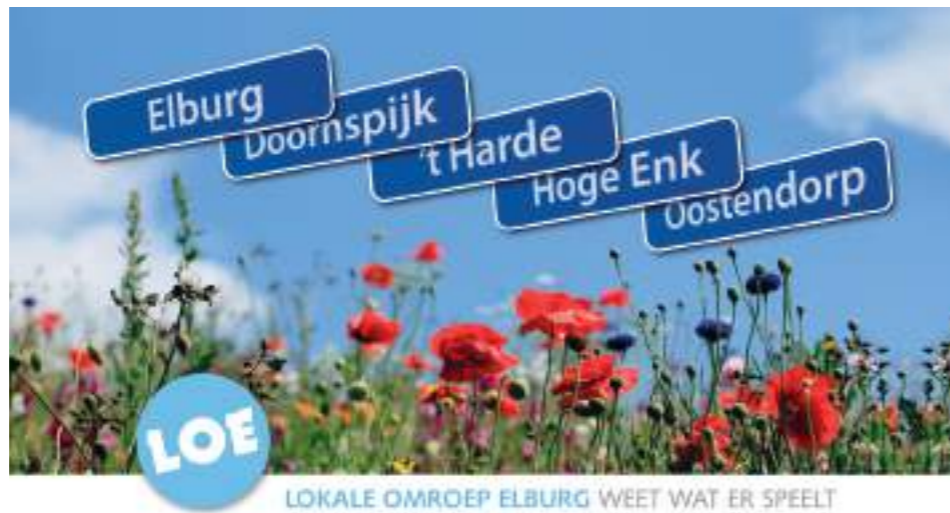
De LOE is een omroep voor alle kernen in de gemeente Elburg.