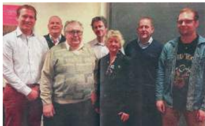
De zeven voorzitters van de lokale omroepen die samen streekomroep De Nieuwe Hanze vormden.