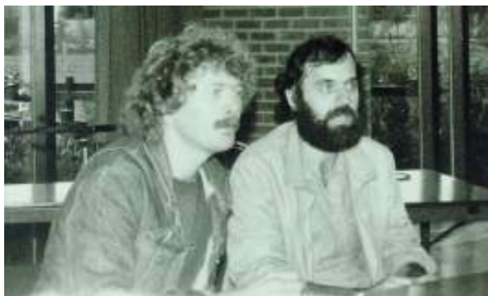
De voorpui van de studio van de LOE aan de Vrijheidsstraat.